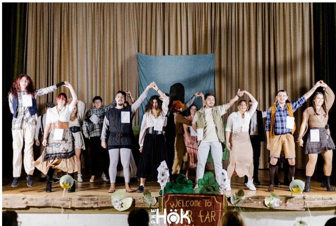
Balul bobocilor - 2024