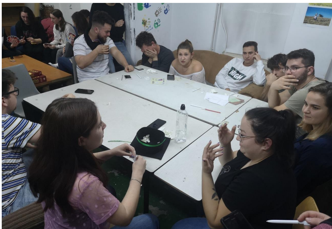
Balul PEN – 2022