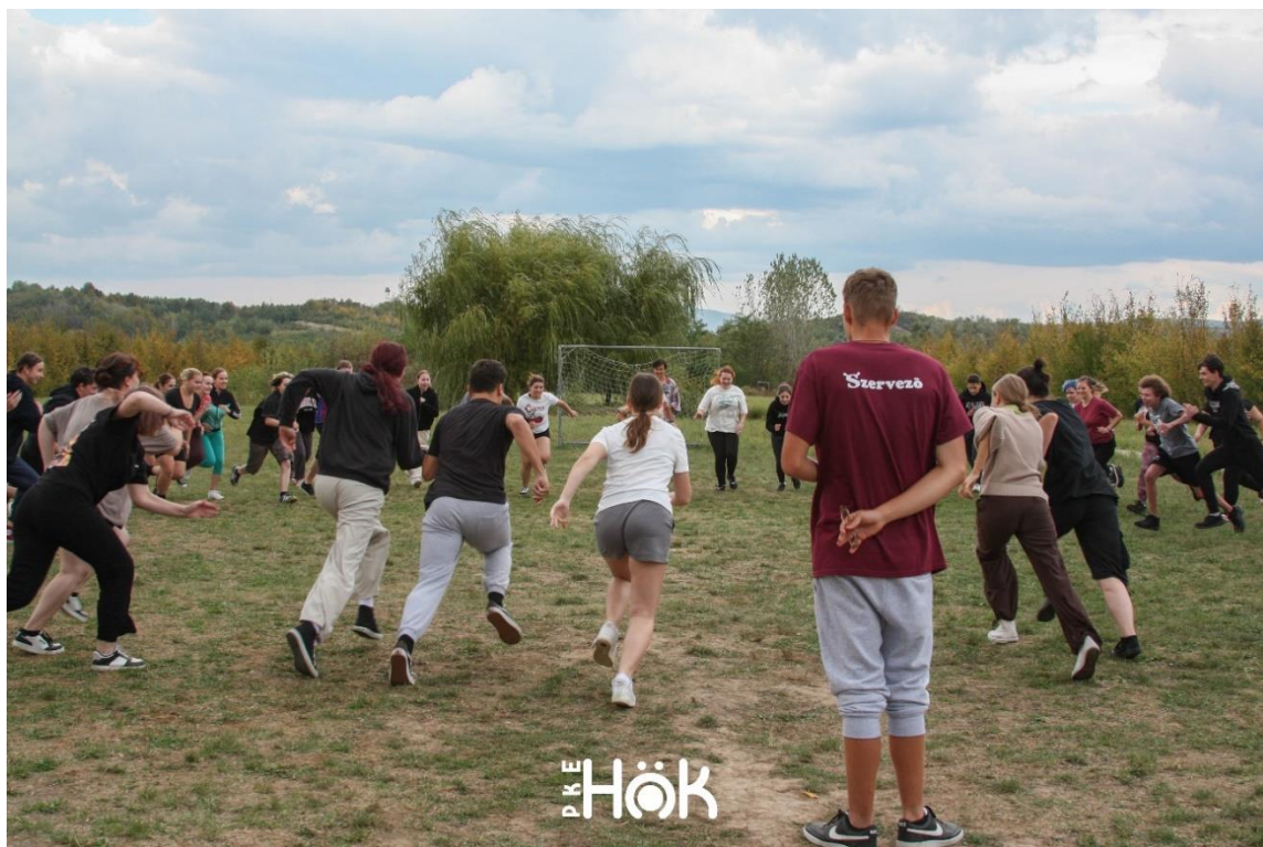
Tabăra bobocilor – 2024