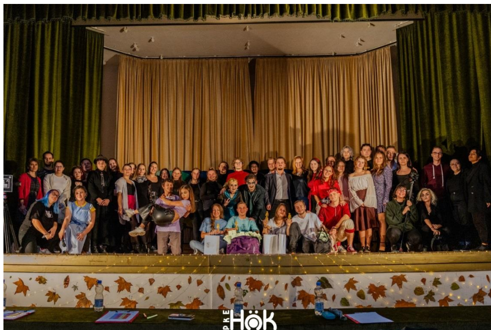
Balul bobocilor – 2023