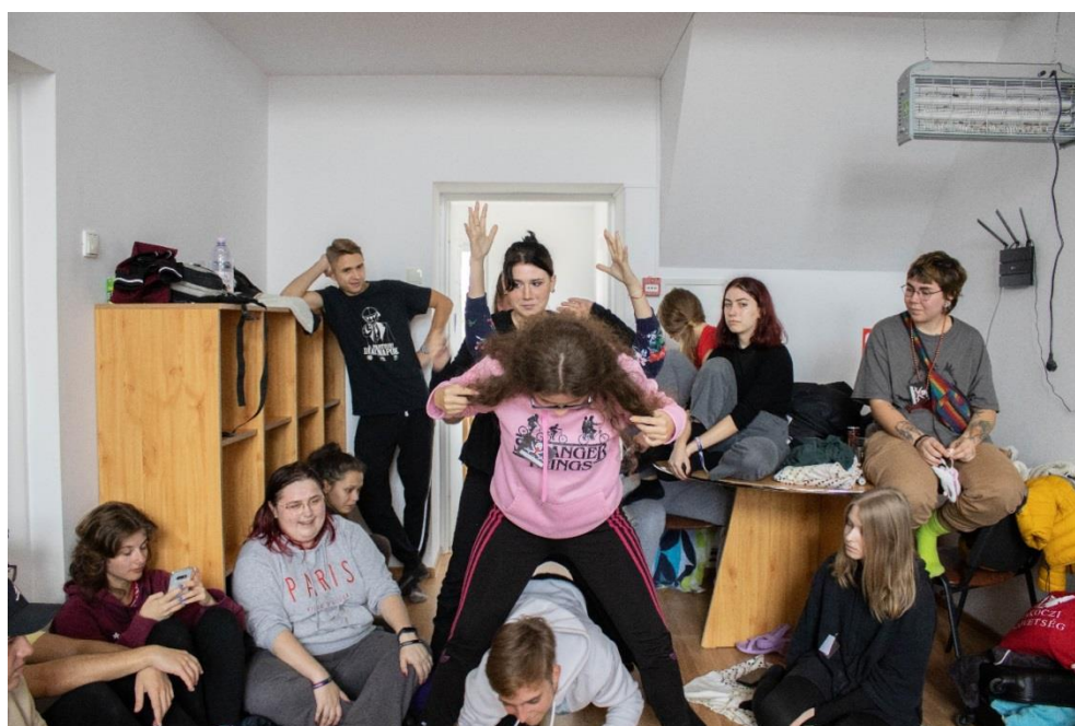
Tabăra bobocilor – 2021