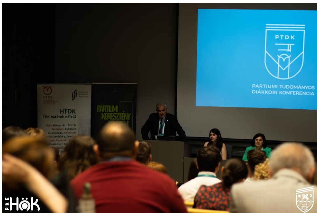
27. PTDK - 2024