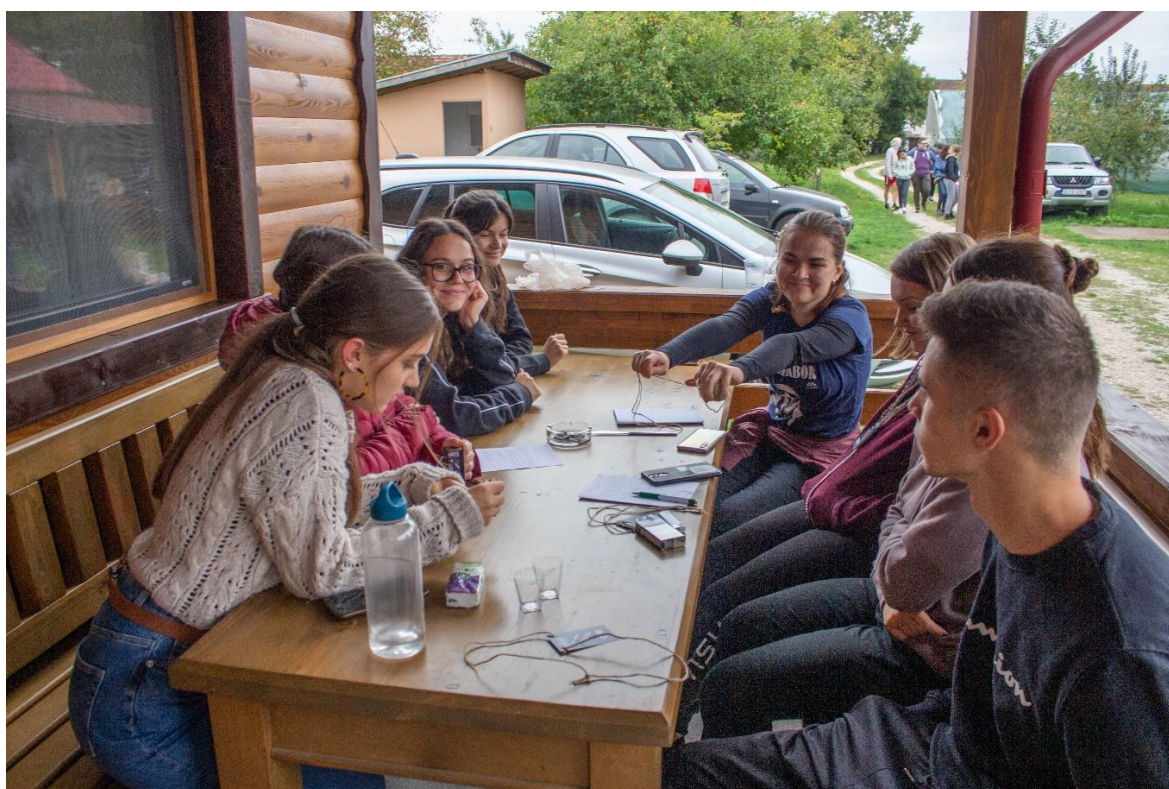
Tabăra bobocilor – 2021